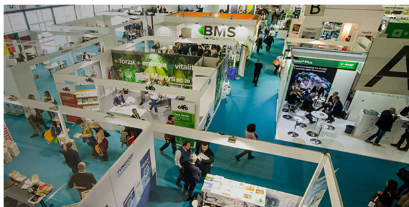
Mercoledì 27 Novembre 2019